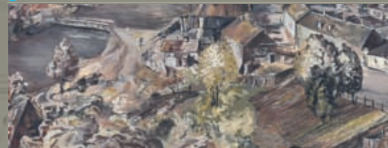
5 Latgales iela 70