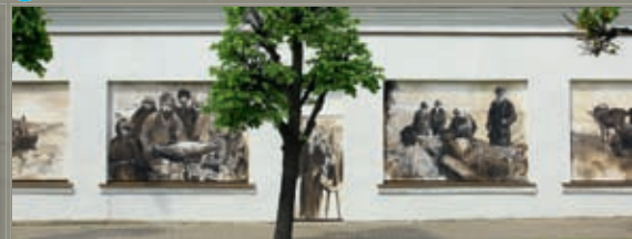
6 Latgales iela 63