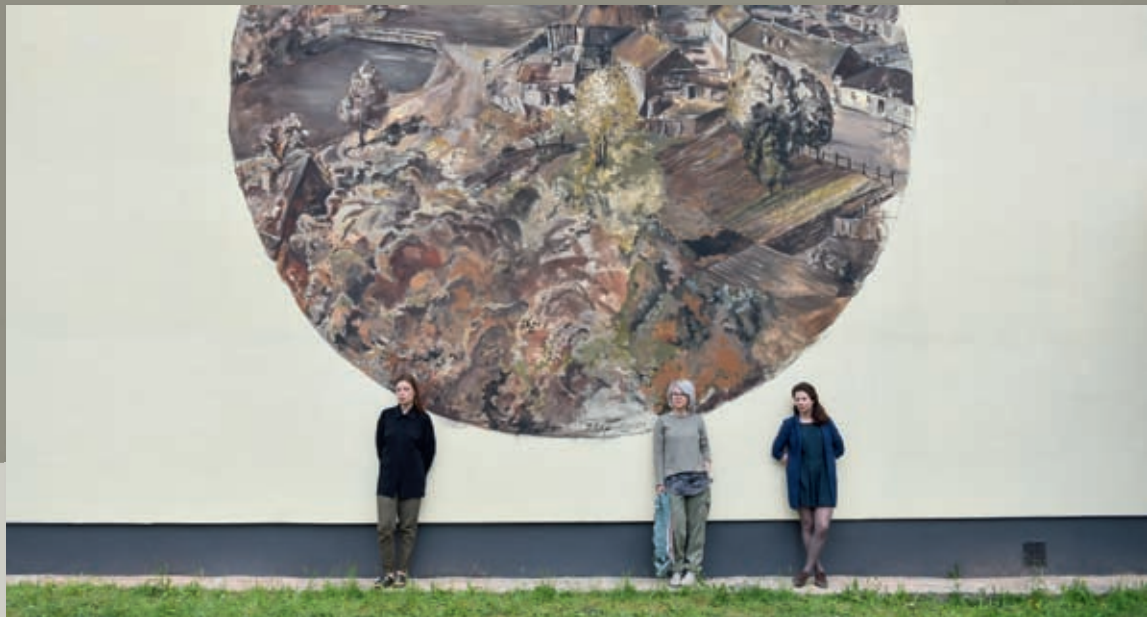
5 Sienas gleznojums (2017) Latgales ielā 70 Gleznojumā redzama klasiskā 20. gs. 30. gadu Rēzeknes ainava, tajā pamanīsiet arī Gustava Leščinska 1858. gadā celtās dzirnavas, kurās 1901. gadā tika iebūvēta Latgalē

pirmā ūdens turbīna. Mūsdienās pie veco dzirnavu tilta vēl saglabājušies vecā bruģa fragmenti. Fotografija tapusi no Rēzeknes Jēzus Sirds katedrāles torņa.