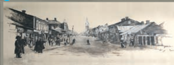
4 Latgales iela 27