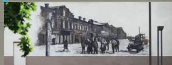
3 Atbrīvošanas aleja 67