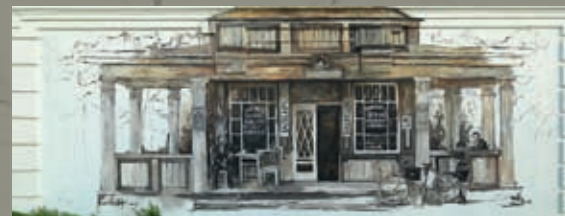
1 Atbrīvošanas aleja 86