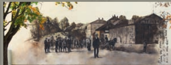
2 Atbrīvošanas aleja 67